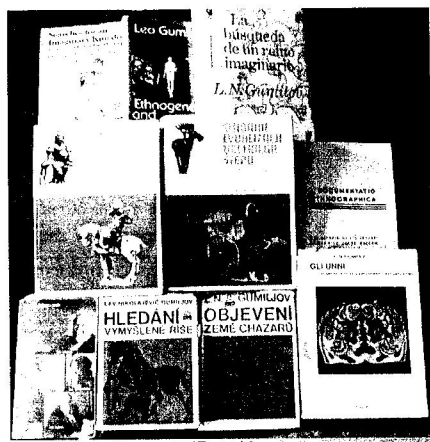
Книги ЛНГ на иностранных языках

— Абсолютно не согласна. Например, сейчас в воспоминаниях некоторых учёных, которые писали на него доносы, что он де не учёный, а «фантазёр», появились даже покаянные высказывания по этому поводу. Кроме того, вы не представляете себе, как много людей посещало его лекции, и их количество все росло и росло, как его защищали многие серьёзные учёные (например, Струве, Тарле, а позже — Лихачёв, Артамонов, Гаель, и многие другие, мон-