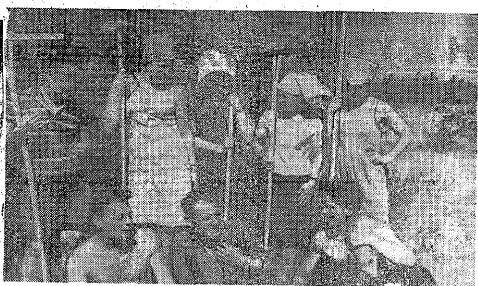
Строители 99-го управления на заготовке сена для совхоза «Будогощь».