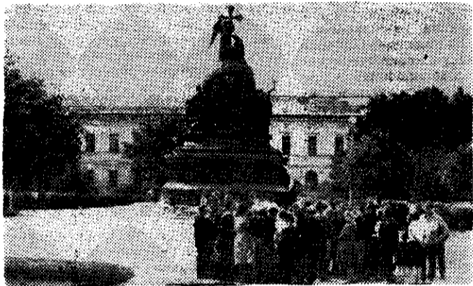
Киришане на экскурсии в Новгороде у памятника «Тысячелетие России».