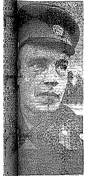
Александрович, зам. секретаря ОВД, лучший сотрудник.